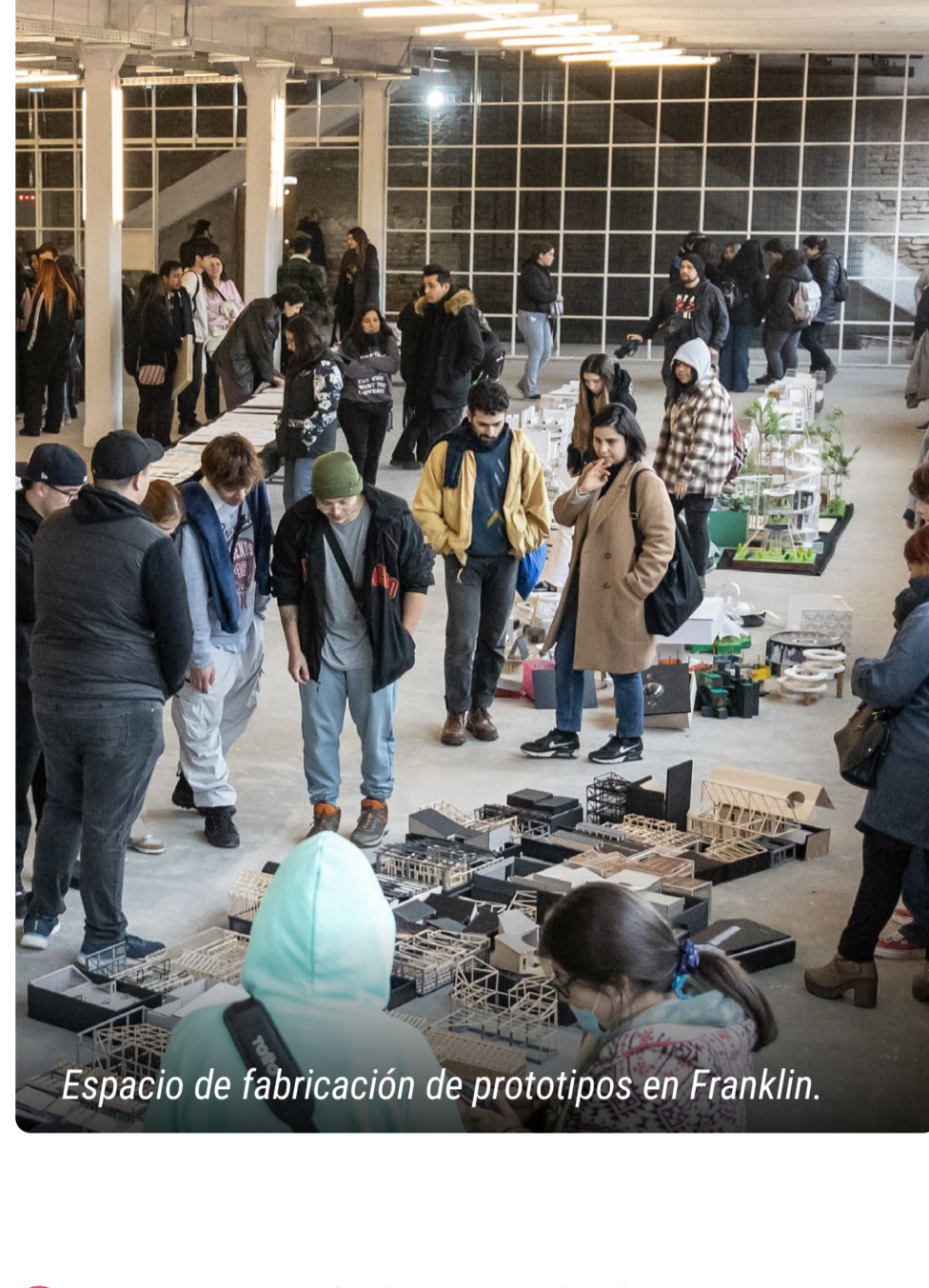
Espacio de fabricación de prototipos en Franklin.